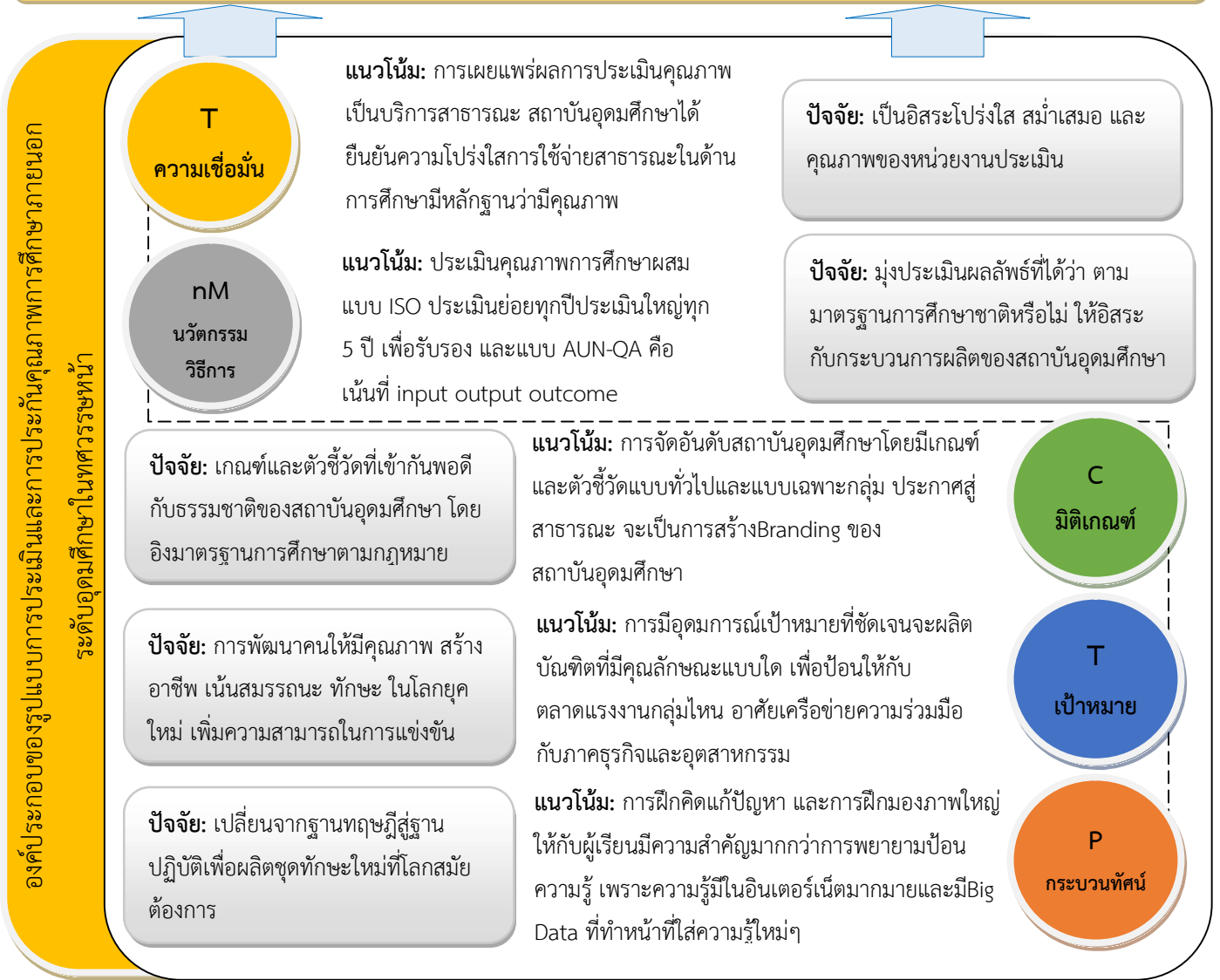
ภาพที่ 5.1 โครงสร้างความสัมพันธ์ของแนวคิด องค์ประกอบ แนวโน้มน กระบวนการและปัจจัยเงื่อนไขของรูปแบบการประกันคุณภาพอุดมศึกษาคุณคิดิจิทัลหรือ PTCnMT Model