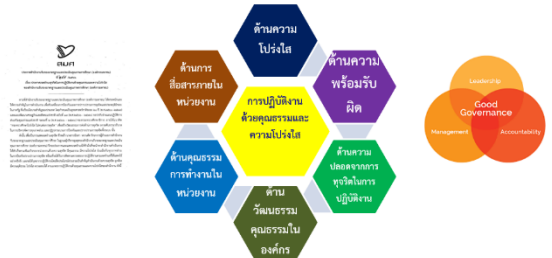
ประกาศเจตจำนงสุจริตในการปฏิบัติงานด้วยคุณธรรมและความโปร่งใสของสำนักงานรับรองมาตรฐานและประเมินคุณภาพการศึกษา (องค์การมหาชน)

ภายใต้แนวคิด “พอเพียง วินัย สุจริต จิตอาสา กตัญญู” รวมถึงการบรรยายโดยสำนักนโยบายและยุทธศาสตร์