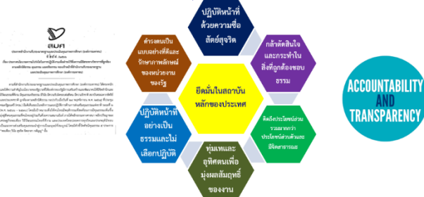
ประกาศนโยบายความโปร่งใสในการปฏิบัติงานเพื่อดำรงไว้ซึ่งความมีอิสระทางวิชาการที่ถูกต้องตามหลักนิติธรรม คุณธรรม และจริยธรรม ของเจ้าหน้าที่สำนักงานรับรองมาตรฐานและประเมินคุณภาพการศึกษา (องค์การมหาชน)

ป้องกัน ปรามปราม และต่อต้านการทุจริตและประพฤติมิชอบสู่องค์กรคุณธรรมภายใต้แนวคิด “พอเพียง วินัย สุจริต จิตอาสา กตัญญู”